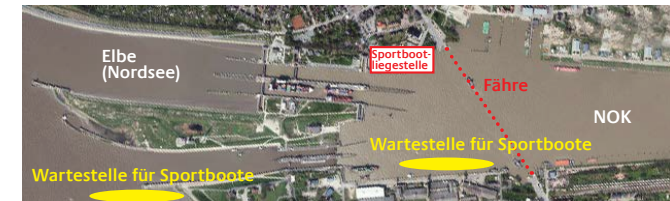
SCHLEUSE BRUNSBÜTTEL: bitte nutzen Sie die Kleine Schleuse.