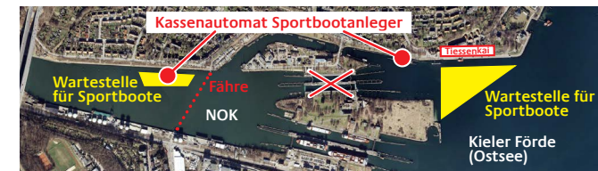
SCHLEUSE KIEL: Bitte nutzen Sie die Große Schleuse. Die Kleine Schleuse ist langfristig außer Betrieb!