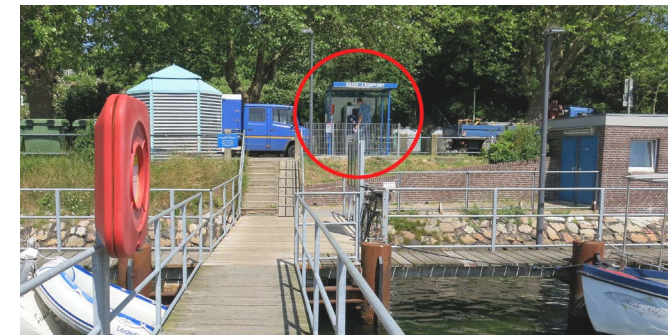
Kassennautomat Sportbootliegestelle westlich vom Tiessenkai, Kiel-Holtenau und beim Hafenaufseher am Tiessenkai